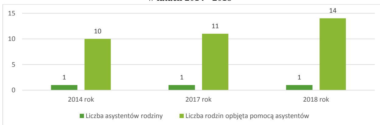
Wykres 2. Liczba rodzin objętych pomocą asystenta rodziny w Gminie Limanowa w latach 2014 - 2018

Źródło: opracowanie własne na podstawie danych GOPS