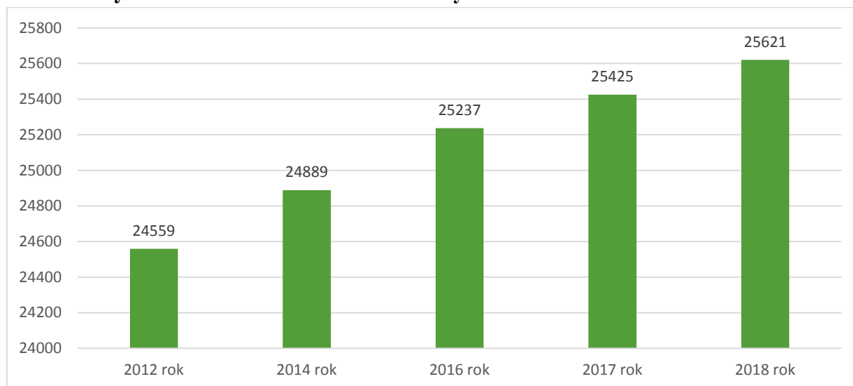
Wykres 1. Liczba mieszkańców Gminy Limanowa w latach 2012 – 2018